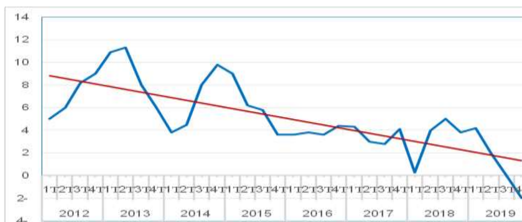
Graphique (1). Evolution du taux de croissance (%) de la Formation Brute de Capital Fixe

L'économie algérienne est une économie rentière qui tire ses recettes dans l'exportation des hydrocarbures (93% en 2019) et dans le total des recettes fiscales représentent près de 60% du PIB. Ainsi, tout choc conjoncturelle, pétrolier, financier ou sanitaire, provenant de l'extérieur affecte considérablement l'équilibre extérieur et accentue la vulnérabilité économique du pays. D'autant plus que l'économie algérienne connaît depuis quelques temps une faible croissance du PIB passant de 1,4% en 2018 à 0,9 % en 2019 (Bouedja & all, 2020, p11). Cette baisse est due en partie à une croissance négative de la production et des prix des hydrocarbures. De même, d'autres secteurs hors hydrocarbures (Bâtiment, BTPH, l'agriculture et le commerce) ont enregistré une évolution négative passant de 3,3% en 2018 à 2,6 % en 2019. Ainsi, selon l'ONS, l'investissement public et privé a évolué de façon décroissante dès 2012 pour enregistrer des tendances négatives en 2019, comme le montre le graphique N°1 ci-dessous :